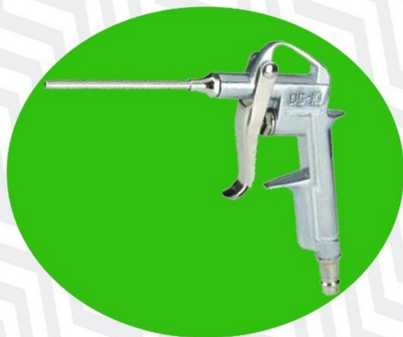
سری تفنگی هوا