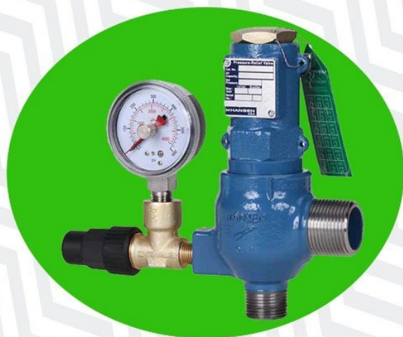
شير تنظيم فشار